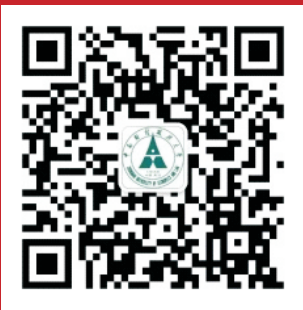
中南财经政法大学研工部官方微信

【刊名题字】吴汉东 【主 办】中南财经政法大学研究生院、 党委研究生工作部 【承 办】中南财经政法大学 《中南研语》编辑部 【主 编】胡立君 周佳玲 吴 凡 【常务副主编】白 玉 袁雪晴 【执 行 主 编】苏 可 【版 块 主 编】江 瑶 连 岚 马佩云 彭春霞 闫过过 禹适宜 【本期技术编辑】韩碧昊 杨曼怡 【本期期刊事务】朱艳优 袁 畅 【本 期 编 委】蔡 艺 陈嘉敏 陈丽颖 陈如月 陈 望 陈懿群 高 可 洪 洋 胡培楠 纪彦凤 贾胜斌 江 博 卢 仕 邵佳颖 宋 萱 涂鑫颖 王月婷 吴雪雅 刁萌萌 谢 佳 杨曼怡 杨 敏 杨舒婷 尹 锦 袁 畅 曾 飞 张小杰 赵 瑶 朱艳优